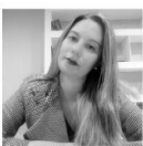
Columnista: LUJÁN CACCIA